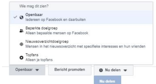
Oude versie Linksonder

Zorg ervoor dat het bericht alleen zichtbaar zal zijn voor uw Duitse volgers op Facebook. Klik hiervoor op de knop 'Openbaar'. Kies vervolgens voor 'Beperkte doelgroep'.