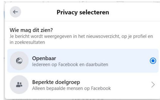
Nieuwe versie Linksboven